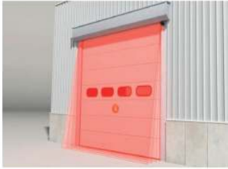
Puertas Automáticas Industriales